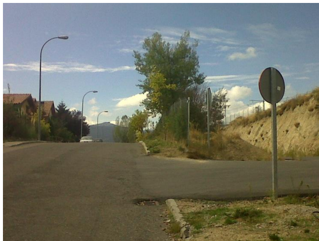
(1) Perspectiva de la señal de prohibición, en su acceso desde Cercedilla, por la calle Molineras.