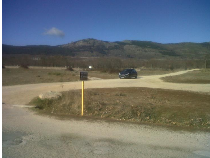
Foto 1: En el Cordel del Toril, indicación hacia “Prados Monteros”.